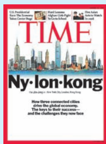
■《時代》指紐倫港正邁向嶄新高峰