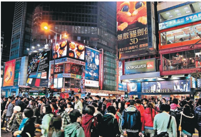
■要成為國際都會，必先擁有頂尖國際金融中心的特質，以及健全法制，香港是全中國絕無僅有達到這些條件的城市。

如《金融時報》去年11月29日的報道指：「為響應最近共產黨憲章控制國家日益商業化的傳媒行業，中國禁止