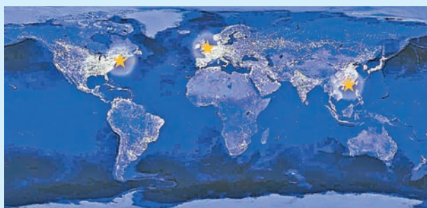
■過去四百多年，僅孕育了紐約和倫敦兩個國際都會，香港有機會成為第三個。